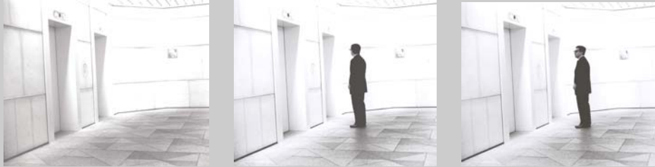
T12 untitled 6 - 8, 2002 , Gelatinesilberabzug auf Aluminium, laminiert, Auflage 6 + 2 Künstlerexemplare, verso signiert, numeriert und betitelt, je ca. 80 x 100 cm © Spiros MARGARIS