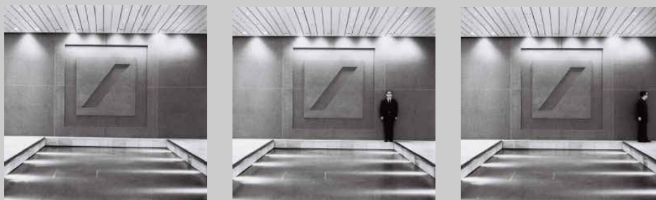
T12 untitled 40 - 42, 2002 , Gelatinesilberabzug auf Aluminium, laminiert, Auflage 6 + 2 Künstlerexemplare, verso signiert, numeriert und betitelt, je ca. 80 x 83 cm © Spiros MARGARIS

Silent Benefiz-Kunstauktion until March 8, 2003