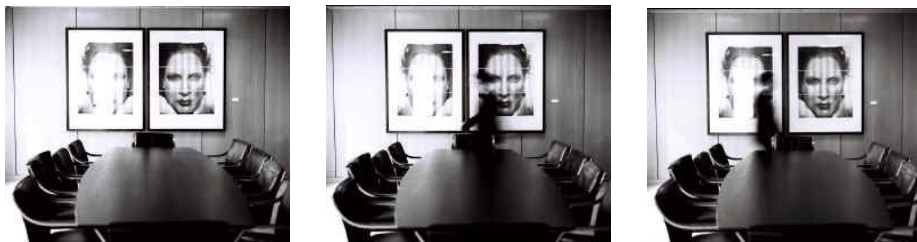
T12 untitled 1 - 3, 2002 , Gelatinesilberabzug auf Aluminium, laminiert, Auflage 6 + 2 Künstlerexemplare, verso signiert, numeriert und betitelt, je ca. 69 x 85 cm